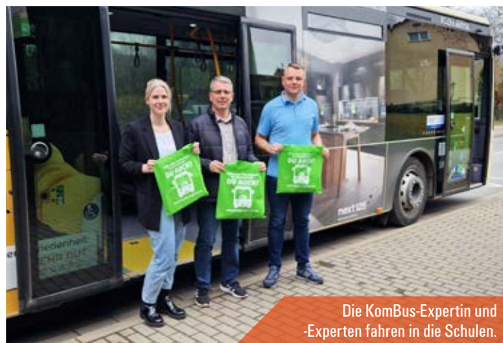
Die KomBus-Expertin und -Experten fahren in die Schulen.

» Wie tief ist die Grube in der Bus-Werkstatt?«