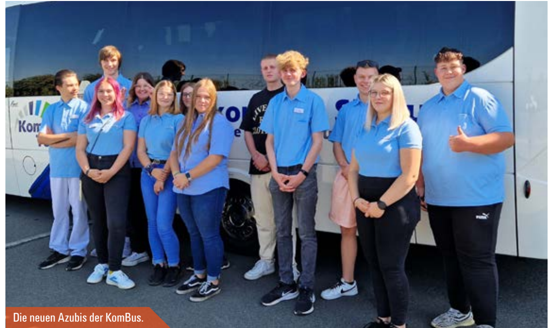
Die neuen Azubis der KomBus.

» Jeder vierte Bus wird von einer Frau gesteuert, Tendenz steigend. «