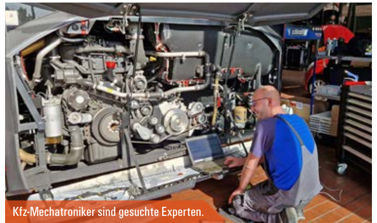
Kfz-Mechatroniker sind gesuchte Experten.

Viele Leserinnen und Nutzer sind täglich im Internet und auf digitalen Plattformen unterwegs. Die KomBus nimmt den Trend auf und bespielt verstärkt ihre Social-Media-Kanäle mit aktuellen Informationen, Fotos und Videos. Am Ende der KomBus-Startseite sind verlinkte Symbole platziert, die auf